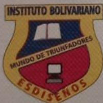
Diana Leal Del Rio C.C.: 52781366 de Bogotá Rectora

Por haber cursado y aprobado los estudios correspondientes al nivel de educación media académica, y cumplido los requisitos establecidos en el proyecto educativo institucional, según los planes y programas vigentes establecidos por la ley.